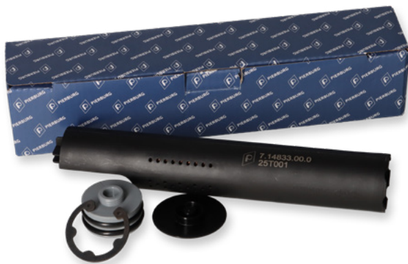
Filter-Trockner mit Zubehör (Art.-Nr. 7.14833.00.0) für Tesla

Motorservice hat ein Servicekit bestehend aus Filter-Trockner und Zubehör (Art.-Nr. 7.14833.00.0, OE-Referenz 1597579-A0-A) für den Kältemittelkreislauf von Tesla in sein Aftermarket-Programm aufgenommen. Mit dem Filter-Trockner deckt Motorservice weltweit über 3,7 Millionen Fahrzeuge des Elektrofahrzeugherstellers ab. Das Servicekit ist für folgende Modelle geeignet: